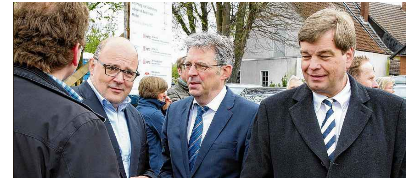
Im Mai 2016 waren es noch zwei Bundestagsabgeordnete aus Minden-Lübbecke: MdB Steffen Kampeter (2.v.l.) und MdB Achim Post (2.v.r.) und Verkehrsstaatssekretär Enak Ferlemann bei der Feierstunde zur Einweihung der Lärmschutzwand an den Schienen in Dankersen.

Ob der Tunnel abzuwenden sei, darauf antwortet Post diplomatisch: „Mir wäre es lieber gewesen, wenn der Staatssekretär gesagt hätte: ‚Sie haben mich überzeugt.‘ Ich glaube,